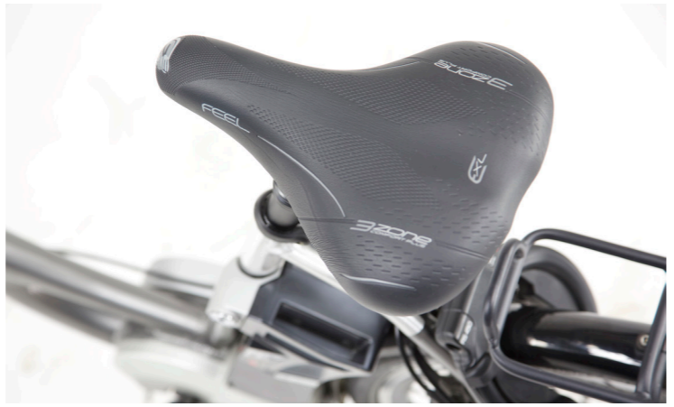
RIGHT The saddle, suitable even for the XXL-sized posterior and with a suitably robust seatpost, is also a comfortable ride for the more lightweight. Most test riders didn't mind the small amount of sideways play in the suspension seatpost. The Raleigh Dover XXL is comparatively light at 27,3 kg despite its comprehensive specification, including a frame-mounted lock, the unnecessary hub dynamo, suspension fork and many extra-robust components.