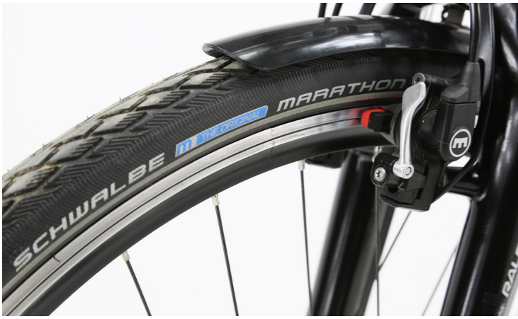
LEFT The saddle, suitable even for the XXL-sized posterior and with a suitably robust seatpost, is also a comfortable ride for the more lightweight. Most test riders didn't mind the small amount of sideways play in the suspension seatpost. The Raleigh Dover XXL is comparatively light at 27,3 kg despite its comprehensive specification, including a frame-mounted lock, the unnecessary hub dynamo, suspension fork and many extra-robust components.