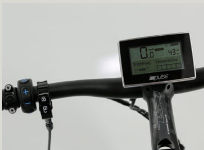
Das Endeavour hat das große Impulse Display mit Fernsteuerung. The Endeavour has the larger Impulse display with remote buttons.