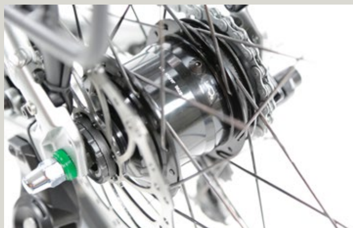
Nur noch selten anzutreffen – die 11-Gang Nabenschaltung von Shimano mit Schmier-nippel und Scheibenbremse. Still seldom seen: the 11-speed Shimano hub gear, with lubrication nipple and disk brake.